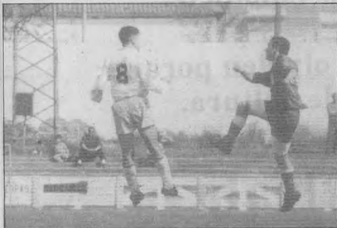
Tras la baja de Choya, el jugador Vega se vuelve a convertir en el 'cerebro' del equipo.

El conjunto alcalareño vuelve a ser tercero y los dos primeros están a un punto, por lo que a 4 jornadas del final puede clasificarse